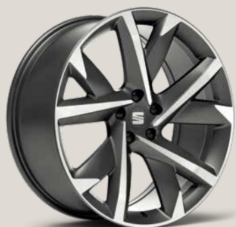
Supreme Cosmo Grey FR FPB