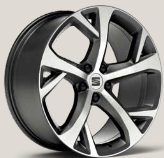
Cosmo Grey FR FPB