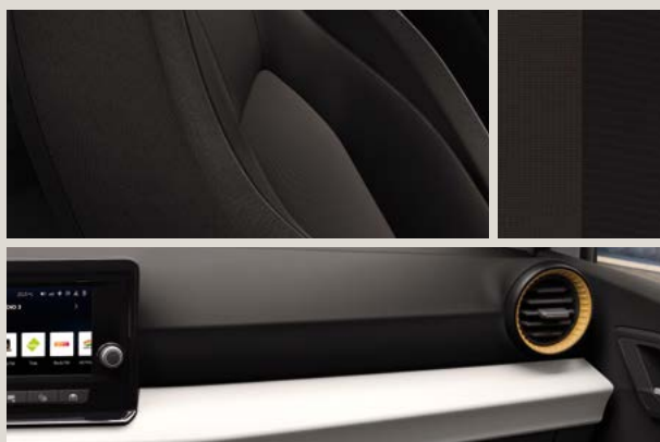
ACERO STOF COMFORT SEATS

Reference R Style St Style Business Connect SBC FR Business Connect FBC Standaard ■