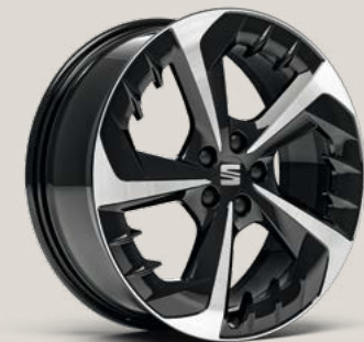
PERFORMANCE BLACK R MACHINED FB