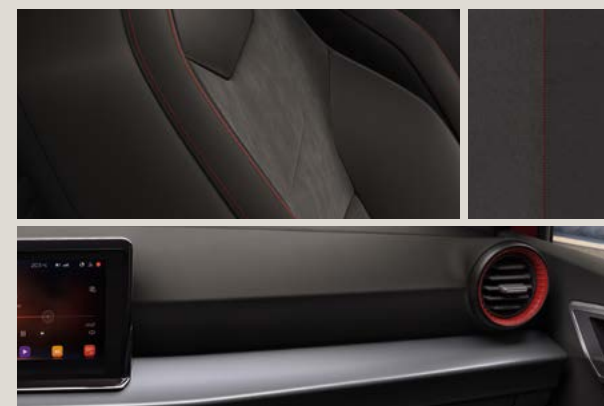
DINAMICA® BLACK SPORT SEATS