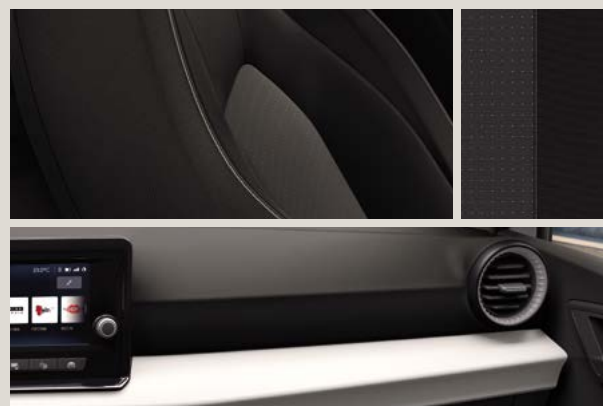
COMO STOF COMFORT SEATS