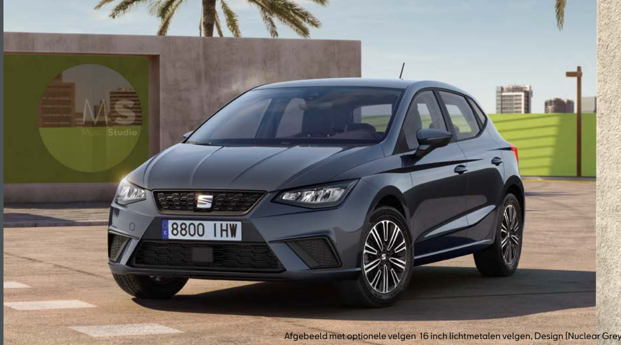
Afgebeeld met optionele velgen 16 inch lichtmetalen velgen, Design (Nuclear Grey)