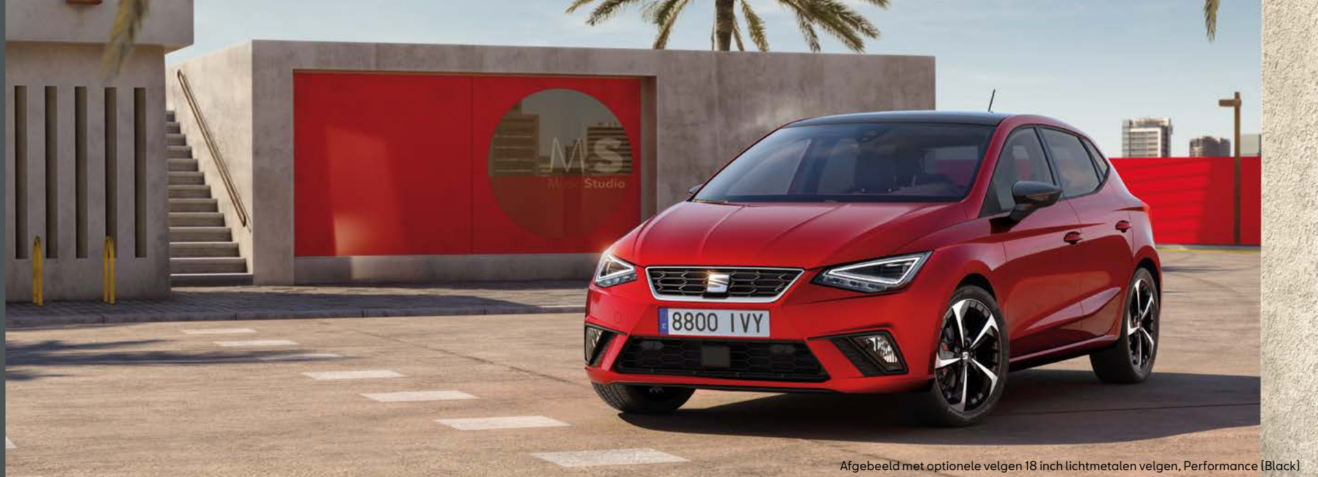
Afgebeeld met optionele velgen 18 inch lichtmetalen velgen, Performance (Black)