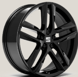
PERFORMANCE GLOSSY BLACK FB

Reference R Style St Style Business Connect SB FR Business Connect FB