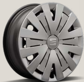
URBAN WIELDOPPEN R