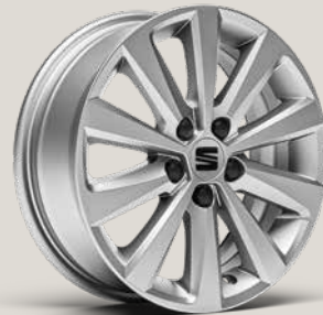
ENJOY BRILLIANT SILVER St SB