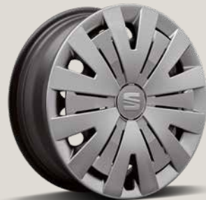
URBAN WIELDOPPEN R