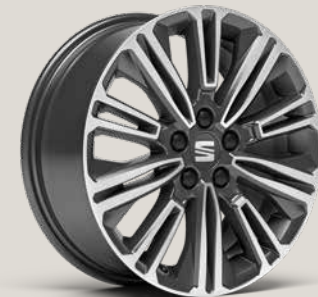
DESIGN NUCLEAR GREY MACHINED St SB