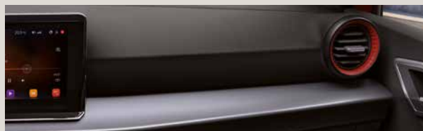
LE MANS STOF SPORT SEATS