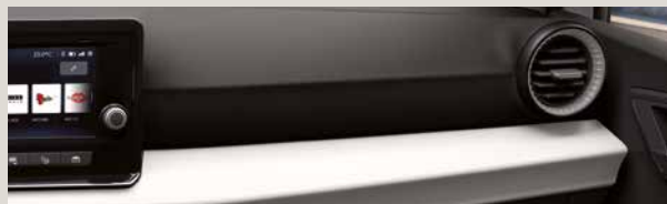
COMO STOF COMFORT SEATS